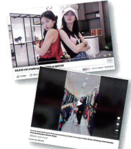
インフルエンサーのSNSでも、店内で買い物をする様子が話題に

6万人分のワクチンを寄付したということは、6万点もの商品を売り上げているということ。そう、「古着de ワクチン」のカンボジア直営センターは大人気のファッションスポットなのだ！休日には、レジの前に長い行列ができ、駐車場も車やバイクでいっぱいになる。若者に人気のモデルやインフルエンサーもよく来店して、買い物を楽しんでいるそう。お店で働くのはポリオによる障がいがあったり、貧困のため過去にゴミ山などで暮らしていたスタッフだ。彼らが1,000平米もの広い敷地に約5万点の商品をきれいに陳列し、いつ来ても楽しんでもらえるように商品を入れ替えて管理している。日々のためめ努力が、お店の魅力につながっている。