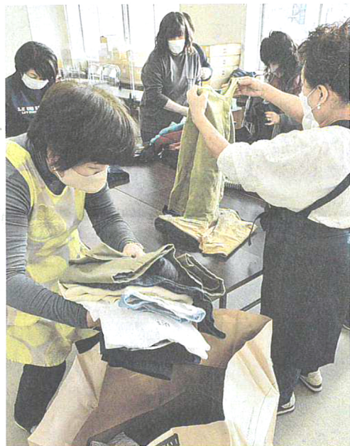
古着を整理して回収袋に入れる商工会女性部員

〒060-8711 札幌市中央区大通西3-6 電話 011-221-2111 www.hokkaido-np.co.jp