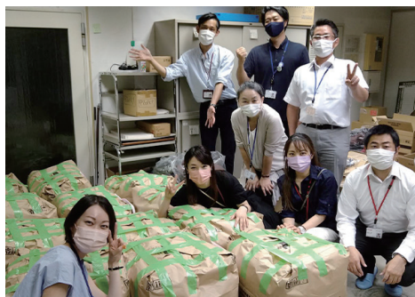
KM バイオロジクス (株)