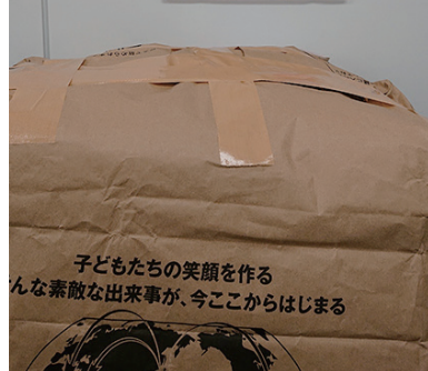
関東支社群馬オフィス