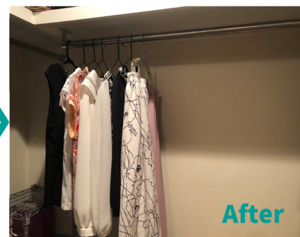
(左) 中小企業マーケット TOKYO2022 に出展した様子 / (中央・右) 古着 de ワクチンを利用したクローゼットの前後