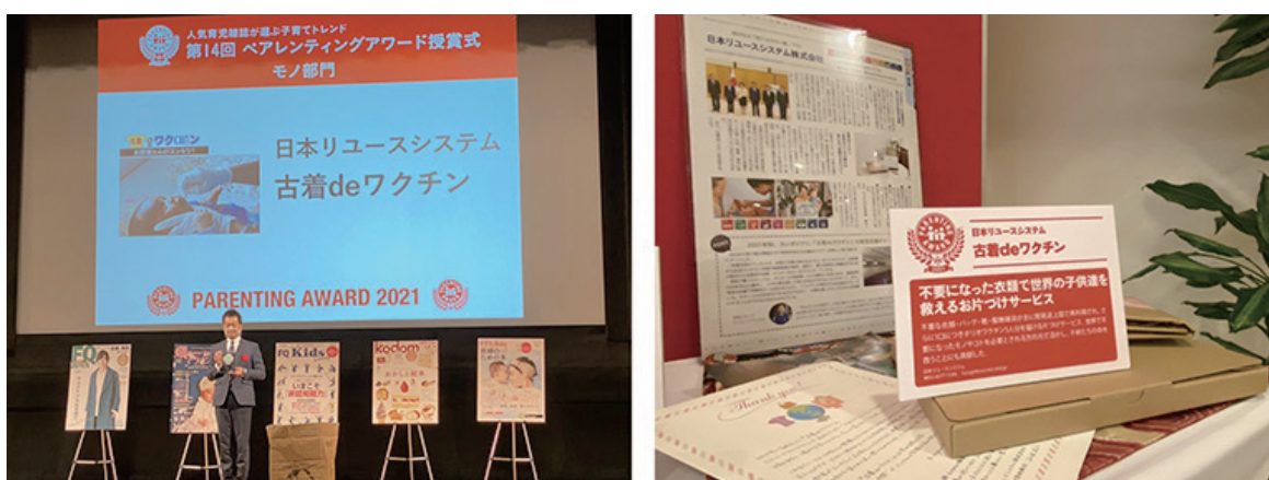
第 14 回 ペアレンティングアワード 授賞式

古着 de ワクチン： https://furugidevaccine.etsl.jp/