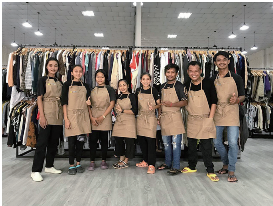
カンボジア 古着 de ワクチン直営センターで働くスタッフ

皆様のお部屋と心がスッキリし、世界中の笑顔にも繋がる、そんな素敵なお片づけ商品のご提供を、今も昔も、そしてこれからも続けてまいります。