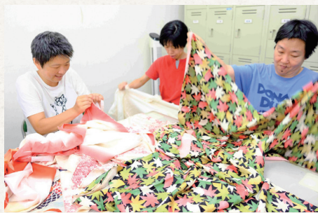
Kimono Upcycle Cloth「ohariko」の製造を担当する日本の福祉作業所

お針子事業の取り組み全体で、SDGsの10のゴール達成に貢献しており、「使用されない着物や帯を有効活用するための仕組みを構築している。モンゴルや日本の福祉作業所で加工されることにより、付加価値のある製品に生まれ変わる等、資源の有効利用とビジネスとが連動している」点などが評価され、環境人づくり企業大賞2019にて「環境大臣賞」を受賞しました。