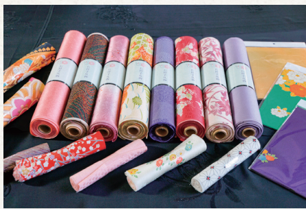
Kimono Upcycle Cloth「ohariko」服飾メーカーだけでなく、ハンドメイドユーザーにも人気です