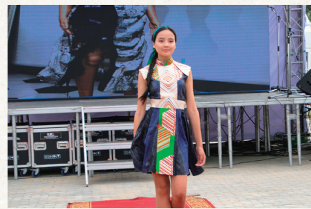
日本の専門学校の生徒とコラボレーションした「お針子デール」をモンゴルのイベントでお披露目