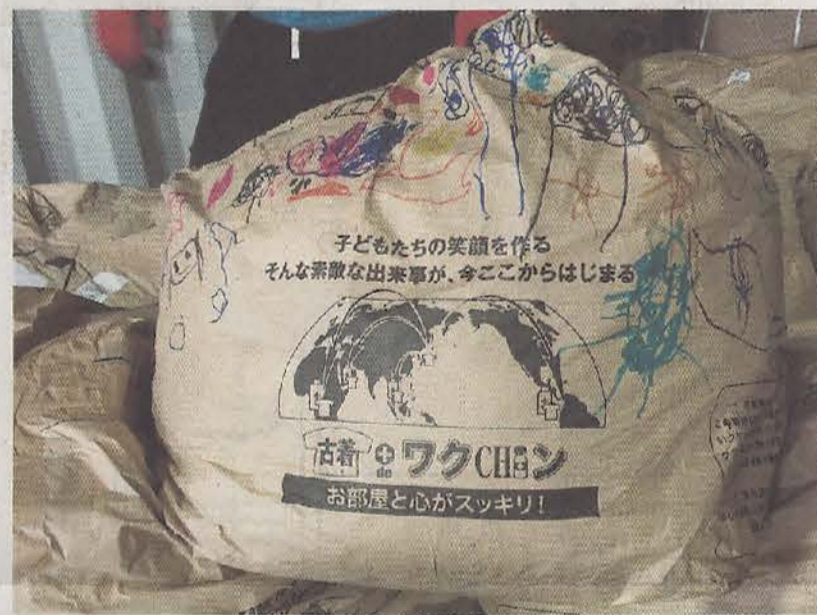
「古着の回収袋」の回収袋。学校や幼稚園などで集めている例もあります。